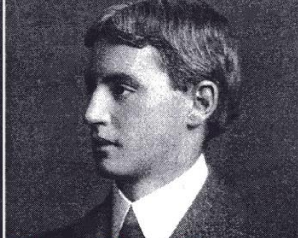
トマス・スチュワート